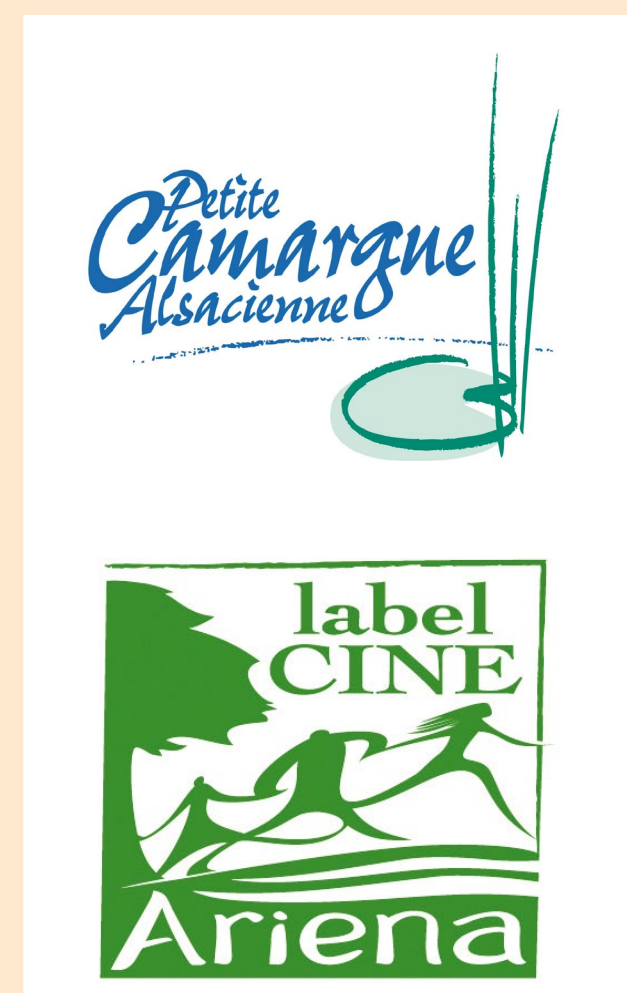
Illustration et conception graphique : Pierre WISSON - www.wisson.fr Conception : Petite Camargue Alsacienne