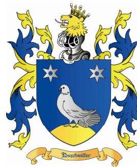
Armoiries timbrées avec la couronne usuelle des Reich de Reichenstein

Après délibération, le Conseil Municipal, à l'unanimité des membres présents approuve le modèle dit « Ecu seul » en tant qu'armoiries de la Commune de BUSCHWILLER. Ces armoiries sont conformes à la définition « D'azur à la colombe d'argent sur un coupeau isolé d'or, accompagné en chef de deux molettes d'argent ». Ces armoiries seront déposées auprès des archives départementales et de la commission héraldique. Il est également décidé que le modèle dit « Armoiries avec la couronne usuelle des Reich de Reichenstein » est approuvé pour des usages culturels pour diverses manifestations. Cette dernière composition prend en compte le cimier à tête de lion en hommage à la famille Reich de Reichenstein.